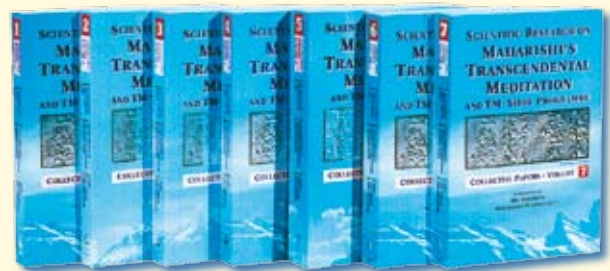
600 wissenschaftliche Studien dokumentieren den grossen Nutzen der Transzendentalen Meditation

Die Technik der Transzendentalen Meditation wird bereits seit 40 Jahren wissenschaftlich untersucht und ist die bei Weitem am besten erforschte Methode zur ganzheitlichen Persönlichkeitsentwicklung. Mehr als 600 wissenschaftliche Studien an 250 Universitäten und Forschungsinstituten dokumentieren ihre positiven Wirkungen. Die Forschungsergebnisse wurden in bedeutenden wissenschaftlichen Fachzeitschriften veröffentlicht und in sieben Bänden Collected Papers von insgesamt über 6'000 Seiten gesammelt.